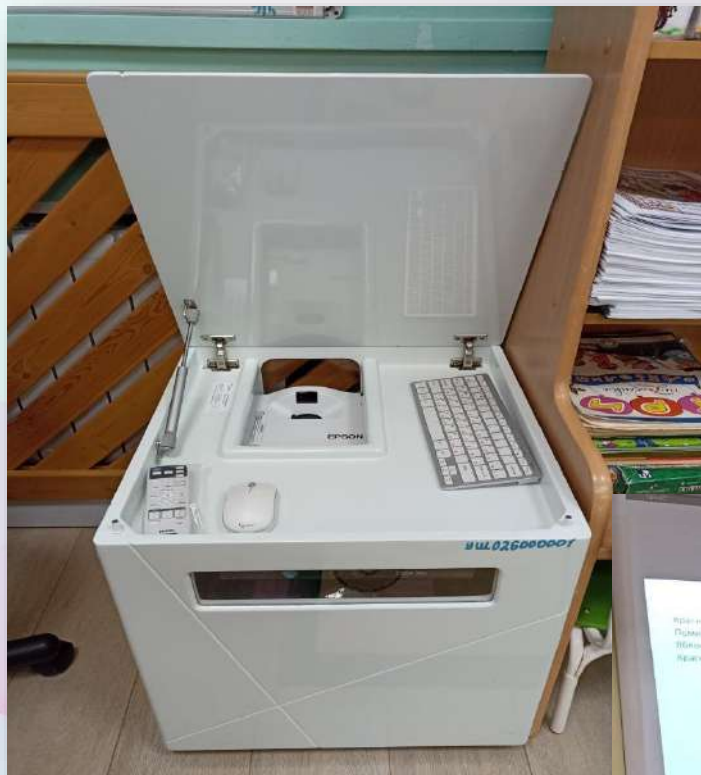
ПАК КУБ «Колибри»